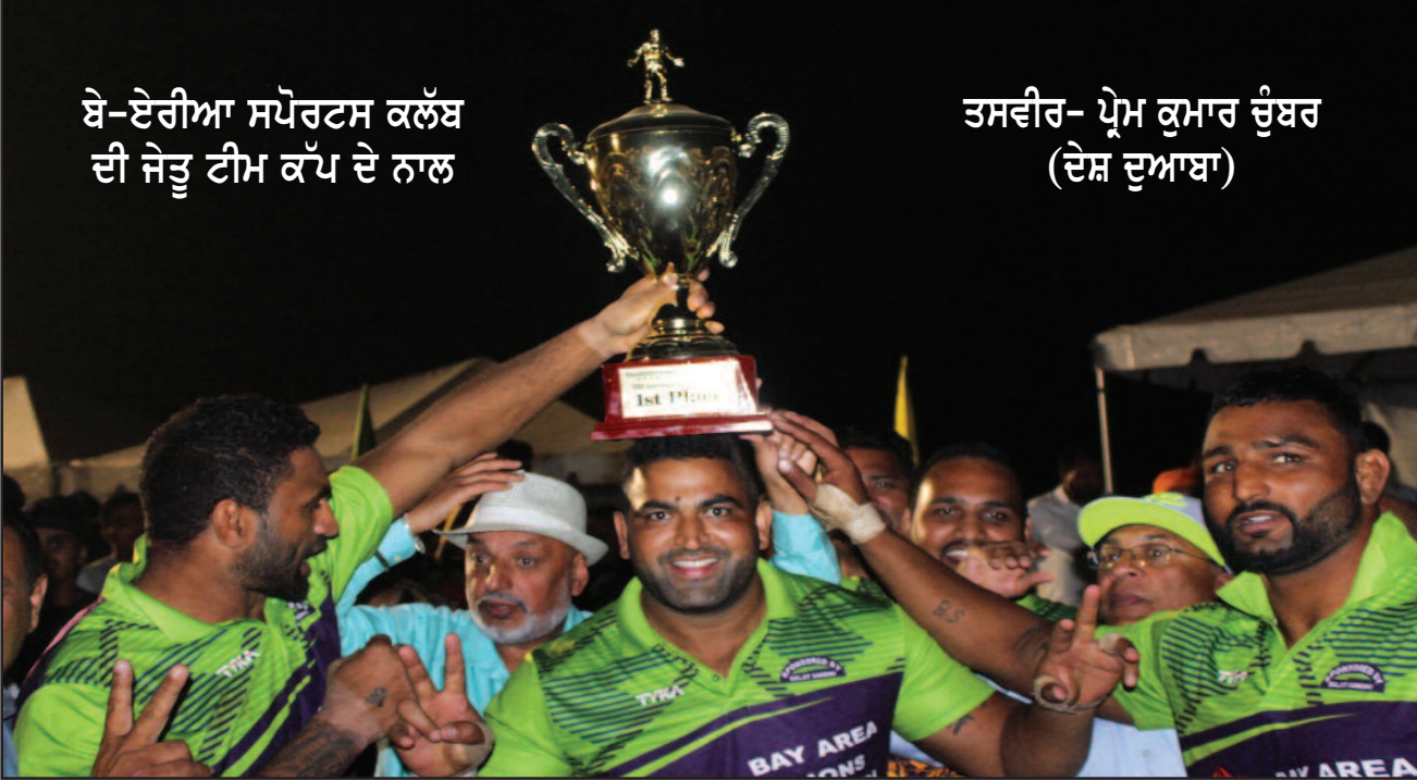
ਬੇ-ਏਰੀਆ ਸਪੋਰਟਸ ਕਲੱਬ ਦੀ ਜੇਤੂ ਟੀਮ ਕੱਪ ਦੇ ਨਾਲ