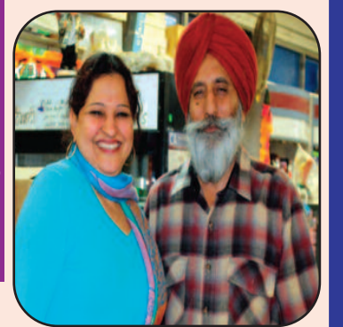
Baksho Kaur Bisla Hardev Singh Bisla

Toilet Water Pressure (Elite 2 Bio Bider) A budget Friendly solution for your desire to feel exceptionally clean and reduce toilet paper waste Only $ 39.99+Tax