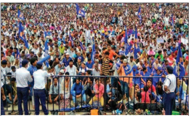
ਉਤਰ ਪ੍ਰਦੇਸ਼ ਵਿਚ ਬਸਪਾ ਦੀ ਮਹਾਂ-ਰੈਲੀ ਨੂੰ ਰਾਸ਼ਟਰੀ ਪ੍ਰਧਾਨ ਕੁਮਾਰੀ ਮਾਇਆਵਤੀ (ਸਾਬਕਾ ਮੁੱਖ ਮੰਤਰੀ) ਨੇ ਕੀਤਾ ਸੰਬੋਧਨ। (ਪੰਜਾਬ ਅੰਦਰ ਬਸਪਾ ਦੀ ਰਾਜ ਪੱਧਰੀ ਫਗਵਾੜਾ ਰੈਲੀ ਸਬੰਧੀ ਹੋਰ ਰਿਪੋਰਟਾਂ ਦੇਖੋ ਸਫ਼ਾ 8 ਉੱਤੇ)