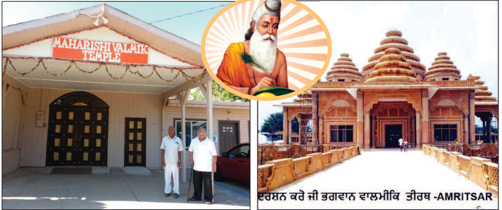
ਦਰਸ਼ਨ ਕਰੋ ਜੀ ਭਗਵਾਨ ਵਾਲਮੀਕਿ ਤੀਰਥ -AMRITSAR