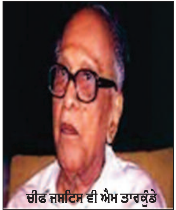
ਚੀਫ ਜਸਟਿਸ ਵੀ ਐਮ ਤਾਰਕੁੰਡੇ

ਪਰ ਤਾਰਕੁੰਡੇ ਦੇ ਸਾਥੀ ਨੌਜਵਾਨ ਪੀੜ੍ਹੀ ਨੂੰ ਔਰਗੇਨਾਈਜ਼ਡ ਤਰੀਕੇ ਨਾਲ ਆਪਣੇ ਨਾਲ ਨਾ ਜੋੜ ਸਕੇ ਤੇ ਬਾਕੀ ਮਰ ਰਹੀਆਂ ਪਾਰਟੀਆਂ ਤੇ ਵਿਚਾਰਾਂ ਦੇ ਨਾਲ ਨਾਲ ਐਮ