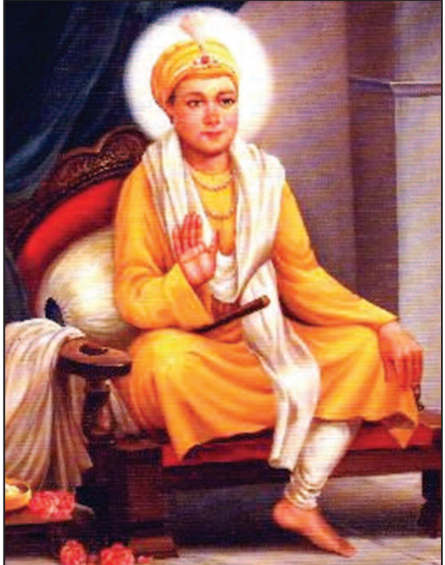
ਅੱਠਵੀਂ ਪਾਤਸ਼ਾਹੀ ਸਾਹਿਬ ਸ੍ਰੀ ਗੁਰੂ ਹਰਿਕ੍ਰਿਸ਼ਨ ਜੀ ਦੇ ਪ੍ਰਕਾਸ਼ ਦਿਹਾੜੇ ਦੀਆਂ ਅਦਾਰਾ 'ਦੇਸ਼ ਦੁਆਬਾ' ਵੱਲੋਂ ਸਮੂਹ ਗੁਰੂ ਪਿਆਰੀ ਸਾਧ ਸੰਗਤ ਜੀ ਨੂੰ ਲੱਖ-ਲੱਖ ਵਧਾਈਆਂ। (ਸਬੰਧਤ ਲੇਖ ਦੇਖੋ ਸਫ਼ਾ 20 'ਤੇ)

ਮੁੱਖ ਸੰਪਾਦਕ : ਪ੍ਰੇਮ ਕੁਮਾਰ ਚੰਬਰ ਸੰਪਰਕ : 916-947-8920 ਫੈਕਸ : 916-238-1393 E-mail : deshdoaba@yahoo.com ਸੰਪਾਦਕ : ਤਰਸੇਮ ਜਲੰਧਰੀ