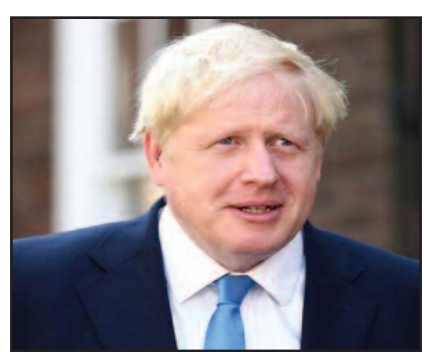
ਸਮਝੌਤਾ ਕਰਨ 'ਚ ਅਸਫਲ ਰਹੀ ਬੋਰਿਸ ਜੌਨਸਨ ਨੇ ਮੁੜ 'ਚ ਪ੍ਰਧਾਨ ਮੰਤਰੀ ਅਹੁਦੇ ਤੋਂ ਅਸਤੀਫਾ ਦੇਣ ਦਾ ਐਲਾਨ ਕੀਤਾ ਸੀ। ਉਸ ਤੋਂ ਬਾਅਦ ਕੰਜ਼ਰਵੇਟਿਵ

ਲੰਡਨ (ਬਿਊਰੋ)- ਯੂਰਪੀ ਸੰਘ ਤੋਂ ਬਰਤਾਨੀਆ ਦੇ ਵੱਖ ਹੋਣ (ਬ੍ਰੈਗਜ਼ਿਟ) ਨੂੰ ਲੈ ਕੇ ਬਣੀ ਬੇਵਸਾਹੀ ਵਿਚਕਾਰ ਬੋਰਿਸ ਜੌਨਸਨ ਨੂੰ ਬਰਤਾਨੀਆ ਦਾ ਅਗਲਾ ਪ੍ਰਧਾਨ ਮੰਤਰੀ ਚੁਣ ਲਿਆ ਗਿਆ ਹੈ। ਸੱਤਾਧਾਰੀ ਕੰਜ਼ਰਵੇਟਿਵ ਪਾਰਟੀ ਦੇ ਪ੍ਰਧਾਨ ਅਹੁਦੇ ਦੀ ਚੋਣ 'ਚ ਜੌਨਸਨ ਨੇ ਆਪਣੇ ਵਿਰੋਧੀ ਜੇਰਮੀ ਹੰਟ ਨੂੰ ਵੱਡੇ ਫਰਕ ਨਾਲ ਹਰਾ ਦਿੱਤਾ। ਜ਼ਿਕਰਯੋਗ ਹੈ ਕਿ ਬਰਤਾਨੀਆ 'ਚ ਸੱਤਾਧਾਰੀ ਦਲ ਦਾ ਮੁਖੀ ਹੀ ਪ੍ਰਧਾਨ ਮੰਤਰੀ ਬਣਦਾ ਹੈ। ਲੰਡਨ ਦੇ ਮੇਅਰ ਤੇ ਵਿਦੇਸ਼ ਮੰਤਰੀ ਰਹਿ ਚੁੱਕੇ ਜੌਨਸਨ ਨੂੰ 92,153 ਵੋਟਾਂ ਮਿਲੀਆਂ ਸਨ। ਉਥੇ ਵਿਦੇਸ਼ ਮੰਤਰੀ ਹੰਟ ਦੀ ਝੋਲੀ 'ਚ 46,656 ਵੋਟਾਂ ਹੀ ਆਈਆਂ। ਜੌਨਸਨ ਬੁੱਧਵਾਰ ਨੂੰ ਅਧਿਕਾਰਕ ਤੌਰ 'ਤੇ ਪ੍ਰਧਾਨ ਮੰਤਰੀ ਦਾ ਅਹੁਦਾ ਸੰਭਾਲਣਗੇ। ਦੱਸਣਯੋਗ ਹੈ ਕਿ ਬ੍ਰੈਗਜ਼ਿਟ ਨੂੰ ਲੈ ਕੇ ਯੂਰਪੀ ਸੰਘ (ਈਯੂ) ਨਾਲ ਕੋਈ ਵੀ