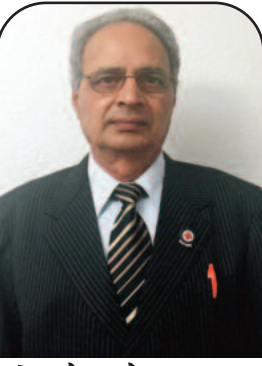
ਪ੍ਰੋ: ਐਚ. ਐਲ. ਕਪੂਰ

ਦੀ ਭਾਰਤ-ਪਾਕਿਸਤਾਨ ਵੰਡ ਨੂੰ ਵੀ ਠੀਕ ਨਹੀਂ ਸਮਝਦਾ। ਉਹ ਇਸ 'ਤੇ ਦੁਖੀ ਹੁੰਦਾ ਹੈ ਤੇ ਅੰਗਰੇਜ਼ਾਂ ਦੀ 'ਪਾੜੋ ਤੇ ਰਾਜ ਕਰੋ' ਦੀ ਨੀਤੀ ਨੂੰ ਨਿੰਦਦਾ ਹੈ। ਉਹ ਲੋਕਾਂ ਦੇ ਪਾਕਿਸਤਾਨ ਤੋਂ ਉੱਠ ਕੇ ਭਾਰਤ ਤੇ ਭਾਰਤ ਤੋਂ ਪਾਕਿਸਤਾਨ ਜਾਣ ਵਾਲੇ ਲੋਕਾਂ ਦੇ ਉਜਾੜੇ ਤੇ ਕਤਲੋਗਾਰਤ ਤੋਂ ਬਹੁਤ ਦੁਖੀ ਹੁੰਦਾ ਹੈ। ਉਸ ਸਮੇਂ ਉਹ ਆਪਣੇ ਪਿੰਡ ਦੇ ਨੌਜਵਾਨਾਂ ਨੂੰ ਇਕੱਤਰ ਕਰਦਾ ਹੈ ਤੇ ਮੁਸਲਮਾਨਾਂ ਦੀ ਰੱਖਿਆ ਕਰਨ ਦੀ ਗੱਲ ਉਹਨਾਂ ਨੂੰ ਸਮਝਾਉਂਦਾ ਹੈ ਤੇ ਮਾਨਵਤਾ ਦੀ ਰਾਖੀ ਲਈ ਨੌਜਵਾਨਾਂ ਨੂੰ ਤਿਆਰ ਕਰਦਾ ਹੈ। ਇਸੇ ਲਈ ਹੀ ਉਹਨਾਂ ਦੇ ਪਿੰਡ 'ਚ ਕਿਸੇ ਵੀ ਮੁਸਲਮਾਨ ਦਾ ਕੋਈ ਕਤਲ ਤੇ ਲੁੱਟਮਾਰ ਨਹੀਂ ਹੁੰਦੀ ਤੇ ਉਹ ਆਪਣੇ ਪਿੰਡ ਦੇ ਸਾਰੇ ਮੁਸਲਮਾਨਾਂ ਨੂੰ ਸੁਰੱਖਿਅਤ ਉਹਨਾਂ ਦੇ ਕੈਂਪ 'ਚ ਪਹੁੰਚਾਉਂਦਾ ਹੈ ਤੇ ਉਹਨਾਂ ਦੇ ਸੁਰੱਖਿਅਤ ਪਾਕਿਸਤਾਨ ਪਹੁੰਚਣ 'ਚ ਮਦਦ ਕਰਦਾ ਹੈ। ਬਾਅਦ 'ਚ ਅਮਨ-ਅਮਾਨ ਦੇ ਦਿਨਾਂ 'ਚ ਉਹ ਪਾਕਿਸਤਾਨ 'ਚ ਗਏ ਤੇ ਆਪਣੇ ਦੋਸਤਾਂ ਨੂੰ ਮਿਲਕੇ ਵੀ ਆਉਂਦਾ ਹੈ। ਇਸੇ ਤਰ੍ਹਾਂ ਹੀ ਉਹਨਾਂ ਦੇ ਪਾਕਿਸਤਾਨੀ ਦੋਸਤ ਵੀ ਕੰਵਲ ਨੂੰ ਮਿਲਣ ਲਈ ਉਹਨਾਂ ਦੇ ਪਿੰਡ ਢੁੱਡੀਕੇ ਆਉਂਦੇ ਹਨ ਤੇ ਕਈ ਦਿਨ ਉਹਨਾਂ ਪਾਸ ਹੀ ਰਹਿੰਦੇ ਹਨ। ਅਜਿਹੇ ਰਿਸ਼ਤੇ ਨਿਭਾਉਣ ਦੀ ਭਾਵਨਾ 'ਚੋਂ ਉਹਨਾਂ ਦੇ ਮਾਨਵਵਾਦੀ ਸੁਭਾਅ, ਪਿਆਰ ਤੇ ਹਮਦਰਦੀ ਦੀ ਭਾਵਨਾ ਦਾ ਇਜ਼ਹਾਰ ਹੁੰਦਾ ਹੈ।