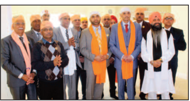
ਸ੍ਰੀ ਗੁਰੂ ਰਵਿਦਾਸ ਟੈਪਲ ਪਿਟਸਬਰਗ ਵਿਖੇ ਧੰਨ ਧੰਨ ਸ੍ਰੀ ਗੁਰੂ ਰਵਿਦਾਸ ਜੀ ਦਾ 643ਵਾਂ ਪ੍ਰਕਾਸ਼ ਦਿਹਾੜਾ ਸ਼ਰਧਾ ਪੂਰਨਕ ਅਤੇ ਉਤਸ਼ਾਹ ਨਾਲ ਮਨਾਇਆ ਗਿਆ। (6 ਸਫ਼ਿਆਂ ਦੀ ਰਿਪੋਰਟ 'ਅੰਬੇਦਕਰ ਟਾਈਮਜ਼ ਵਿਚ ਦੇਖੋ)

ਘਰ-ਘਰ ਮੁਹਿੰਮ, ਰਾਸ਼ਟਰੀ ਸੁਰੱਖਿਆ ਅਤੇ ਸ਼ਾਹੀਨ ਬਾਗ ਦੇ ਮੁੱਦੇ ਦੇ ਬਾਵਜੂਦ ਭਾਜਪਾ ਦਿੱਲੀ ਵਿਧਾਨ ਸਭਾ ਚੋਣਾਂ 'ਚ ਦੋ ਅੰਕਾਂ ਤਕ ਨਹੀਂ ਪਹੁੰਚ ਸਕੀ। ਇਹ ਪ੍ਰਦਰਸ਼ਨ ਭਾਜਪਾ ਲਈ ਡੂੰਘੇ ਮੰਥਨ ਦਾ ਵਿਸ਼ਾ ਹੈ, ਕਿਉਂਕਿ 2015 ਦੇ ਨਤੀਜਿਆਂ ਨੂੰ ਭਾਜਪਾ ਇਹ ਕਹਿ ਕੇ ਮਨ ਬਹਿਲਾਉਂਦੀ ਰਹੀ ਸੀ ਕਿ ਜਨਤਾ ਨੇ ਉਸ ਨੂੰ ਇਕ ਪ੍ਰਯੋਗ ਦੇ ਤੌਰ 'ਤੇ ਲਿਆ ਸੀ। ਅੰਦੋਲਨ ਤੋਂ ਬਾਅਦ ਜਨਮੀ ਪਾਰਟੀ ਨੂੰ ਮੌਕਾ ਦਿੱਤਾ ਸੀ ਪਰ ਇਸ ਵਾਰ ਜਨਤਾ ਨੇ ਜੋ ਫੈਸਲਾ ਕੀਤਾ, ਉਹ ਤਾਂ ਅਜਮਾਉਣ ਤੋਂ ਬਾਅਦ ਕੀਤਾ ਹੈ। ਭਾਜਪਾ ਦਾ ਇਹ ਵੀ ਦਾਅਵਾ ਰਿਹਾ ਹੈ ਕਿ ਸੁਸ਼ਾਸਨ ਸਿਰਫ਼ ਭਾਜਪਾ ਸ਼ਾਸਤ ਰਾਜਾਂ 'ਚ ਕਰਨ ਦਾ ਵੱਡਾ ਦਾਅ ਫੇਲ੍ਹ ਹੋ ਗਿਆ।